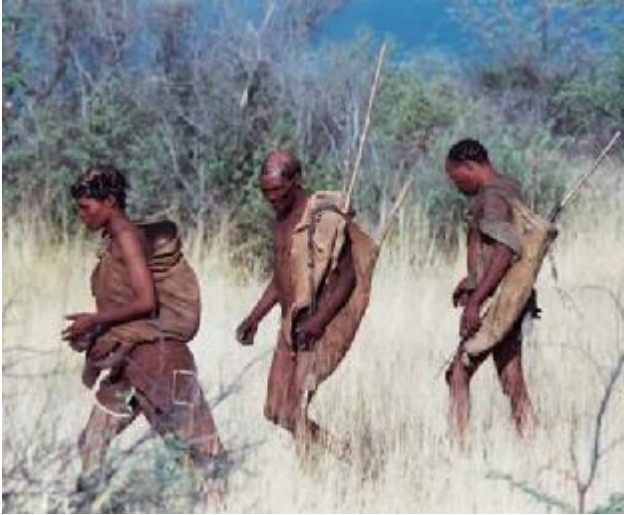
Maun – Game Farm in Hainaveld: 170km, 4h

Die Safari beginnt in Maun, wo wir uns um 07h30 Uhr treffen und die 170km zur Haina Farm beginnen, die im Norden des Central Kalahari Game Reserves liegt.